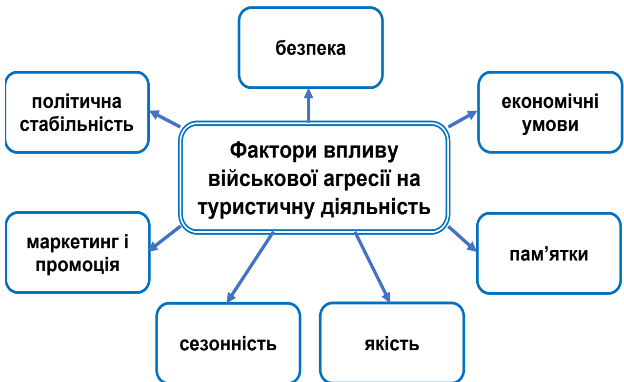
Рис. 2.1. – Основні фактори впливу військової агресії на туристичну діяльність в постраждалих регіонах України

Основні фактори впливу військової агресії на туристичну діяльність в постраждалих регіонах (Рис 2.1):