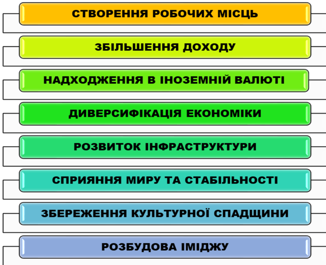
Рис. 1.1 – Вплив соціально-економічних чинників на розвиток туризму та економіки в постраждалих регіонах України від війни