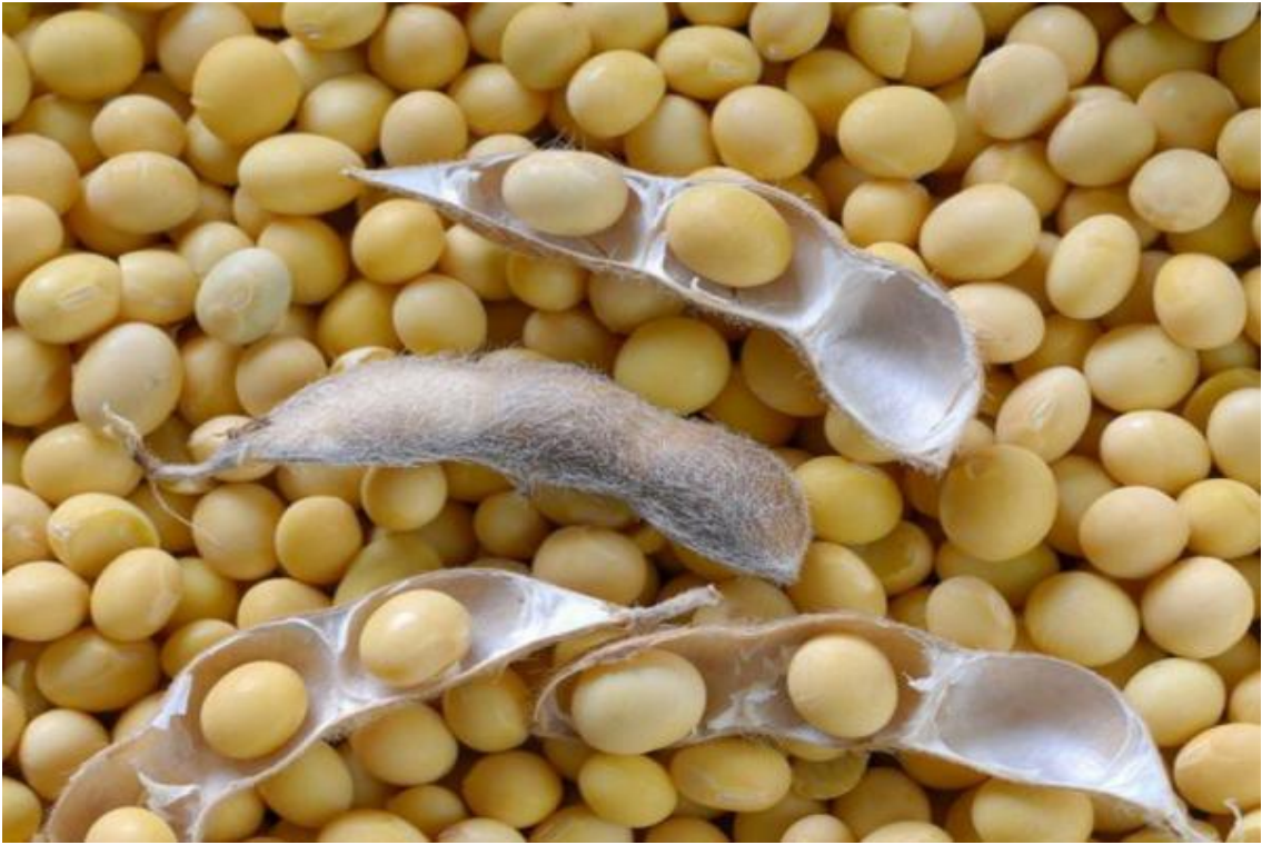
Рисунок Б.3 — Зерно сої сорту Александрит