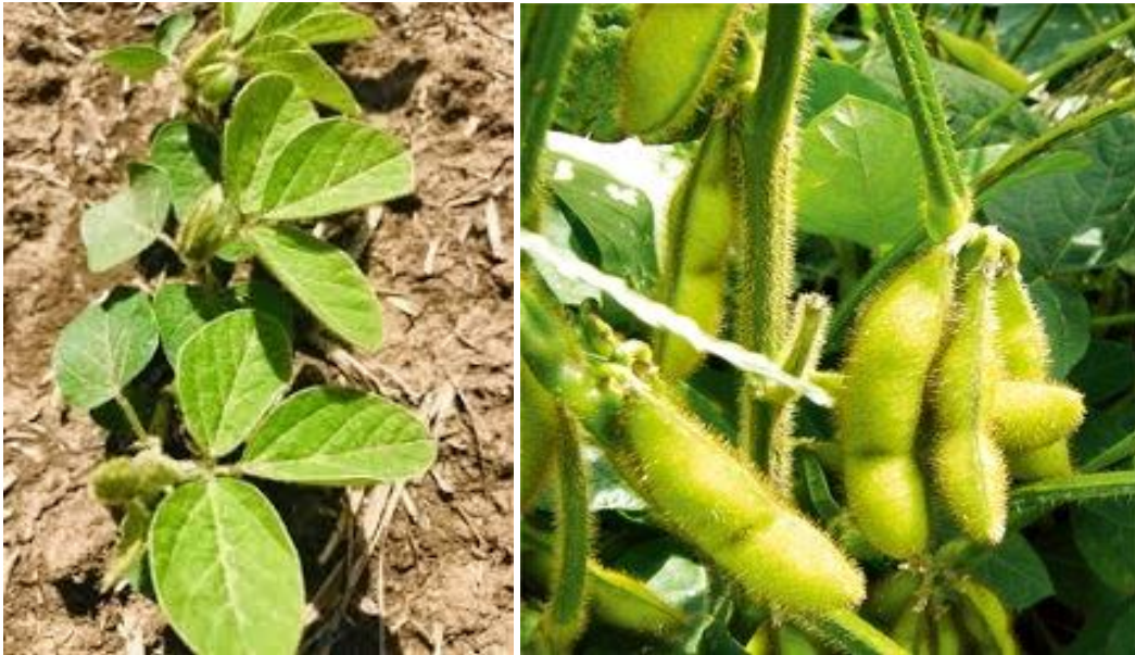
Рис. 2.4 — Сорт сої Крістіна

Вегетаційний період сорту Крістіна в Степовій зоні становить 129 діб, в Лісостепу – 144, а на Поліссі – 155 діб.