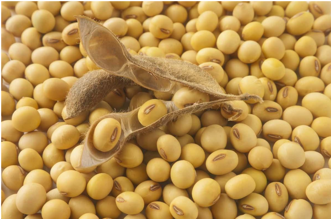
Рисунок Б.4 — Зерно сої сорту Крістіна