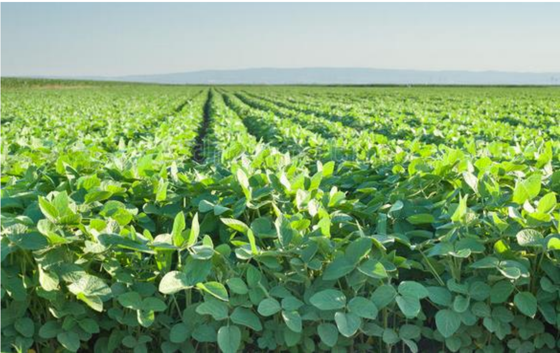
Рисунок Б.2 — Посіви сої сорту Крістіна