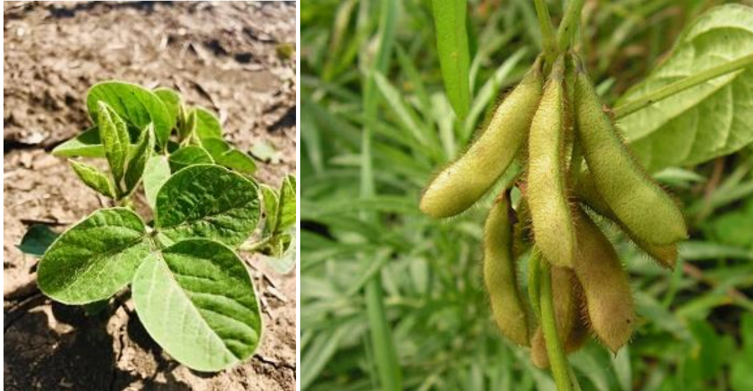
Рис. 2.3 — Сорт сої Александрит

Сорт Александрит високостійкий до септоріозу, пероноспорозу, аскохітозу, бактеріозу і фузаріозу, згідно бальної оцінки він набирає по 9 балів, за стійкістю до вилягання – 7,5-8,6 балів, до осипання – 8,6-8,7 балів, а до посухи – 7,6-8,8 бали.