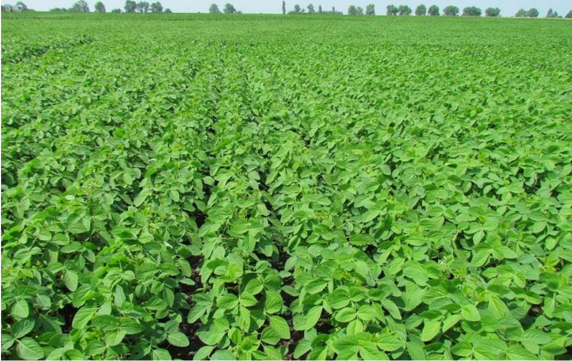
Рисунок Б.1 — Посіви сої сорту Александрит