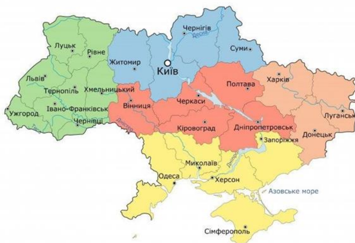
Рисунок 2.1. Карта України за регіонами [18]

потреби туристів , а також враховуючи нинішню популярність замкового туризму , можна відзначити зростання кількості готелів , розташованих у замках . Багато з них перетворюють старовинні замки в розкішні готелі з усіма сучасними зручностями. У світі є багато прикладів реставрації замків і перетворення їх на готелі . Бо й на землі України багато замків , укріплень тощо . Найпопулярніші: Акерманська фортеця в місті Білгород - Дністровський, Мукачівський замок або замок Паланок у м. Мукачево , Тараканівська фортеця чи форпост у с.Дубно . Тараканів, Палац Шенборнів , Вишнівецький сільський палац та ін . Такий європейський досвід можна здійснити в замках України , розширюючи сферу гостинності , залучаючи туристів тощо , як одного з найбільших регіонів країни . , де розташовано багато замків , є західним регіоном . До складу Західної України входять 8 областей: Волинська, Закарпатська, Івано-Франківська, Львівська, Рівненська, Тернопільська, Хмельницька, Чернівецька. У смолінігу . Зеленим позначено 1 область Західної України .