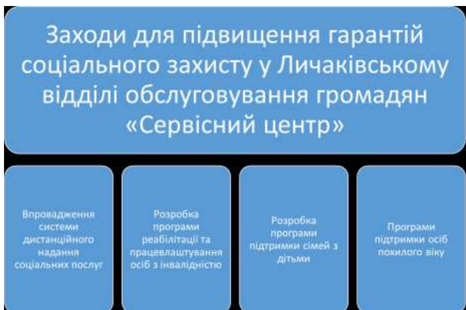
Рисунок 3.2 Заходи для підвищення гарантій соціального захисту у Личаківському відділі обслуговування громадян «Сервісний центр»

системи соціального захисту. На підставі аналізу результатів стану соціального захисту населення нами запропоновані адміністрації «Сервісного центру» конкретні ідеї, які можна розглянути з метою підвищення гарантій соціально незахищеним верствам населення (рисунок 3.2).