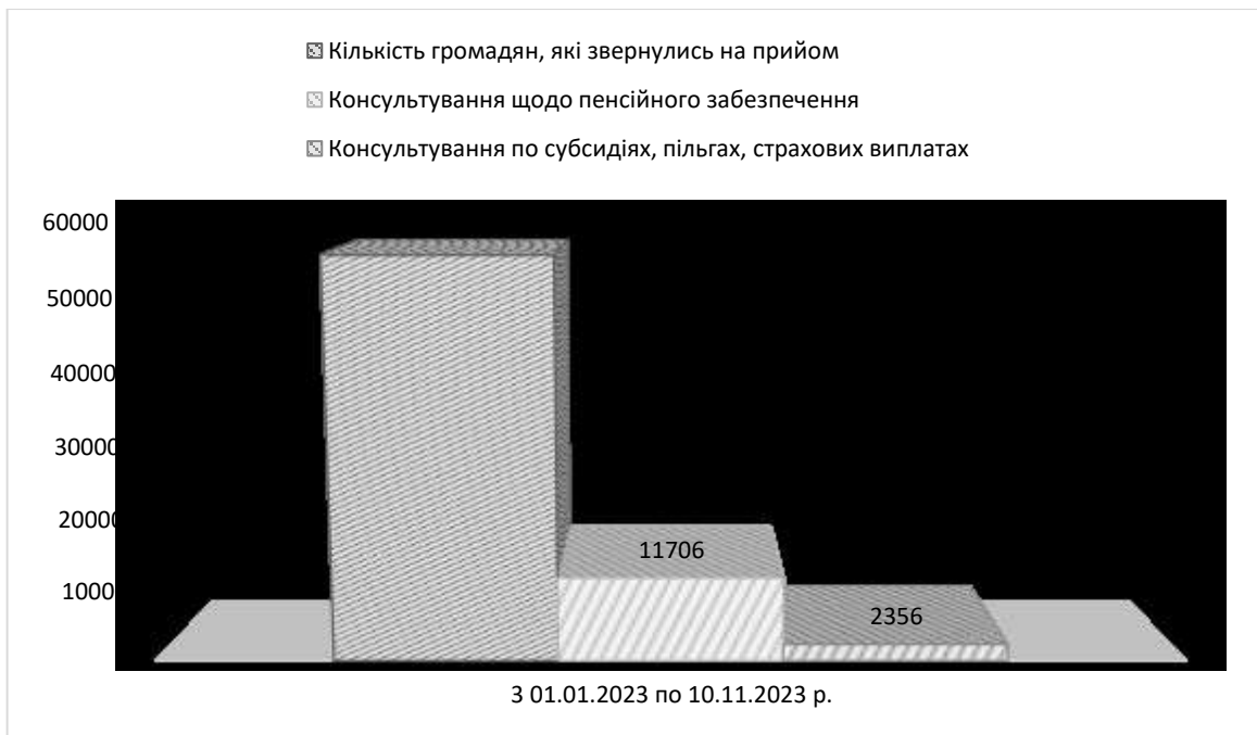
Рисунок 2.2 Структура звернень громадян до Личаківського відділу обслуговування громадян «Сервісний центр» ГУ ПФУ у Львівській області

Проведений аналіз діяльності Личаківського відділу обслуговування громадян «Сервісний центр» ГУ ПФУ у Львівській області дозволяє окреслити напрями його подальшого функціонування. В першу чергу це покращення якості надання послуг- відділ зобов'язаний постійно працювати над підвищенням якості надання послуг населенню. З цією метою відділу доцільно впроваджувати нові технології, які дозволяють автоматизувати процеси надання послуг, наприклад, електронну систему документообігу. Також необхідно проводити навчання працівників відділу з метою підвищення їх професійної кваліфікації, впроваджувати систему контролю якості надання послуг, яка дозволяє своєчасно виявляти та усувати недоліки в роботі відділу. Важливим завданням на сьогодні є розширення спектру послуг, відділ може надавати консультації з питань пенсійного забезпечення, допомогу в оформленні документів для отримання пенсії, розглядати скарги та звернення громадян щодо пенсійного забезпечення. Відділ може запровадити нові форми надання послуг, наприклад, дистанційні, що дозволяють громадянам отримувати послуги без необхідності відвідувати відділ. Загалом