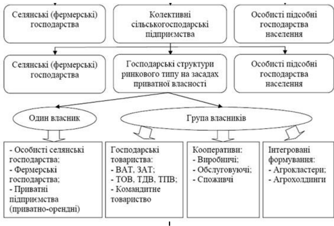
Рис. 1.1. Трансформування сільськогосподарських господарюючих форм в агросекторі економіки України

Сформовано автором на основі опрацьованих джерел [3, 8, 9, 10]