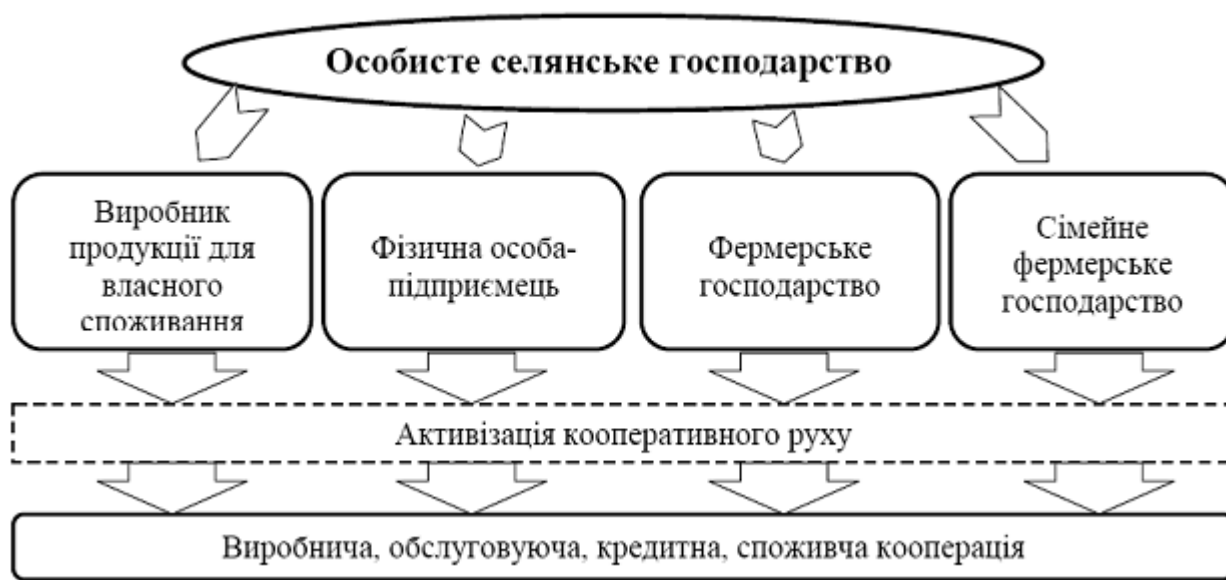
Рис. 1.3. Схема процесу трансформації приватних бізнесструктур

Таким чином, питання набуває актуальності через ідеї теорії селянського господарства, яка стверджує, що селяни можуть реалізувати свій потенціал підприємництва шляхом перетворення селянських господарств у підприємницькі структури (рис. 1.3.).