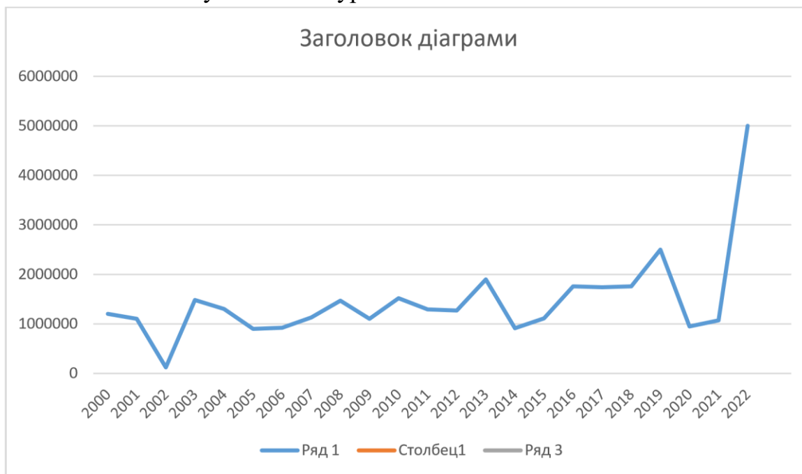
Рисунок 2.2 – Туристичні потоки м. Львова.