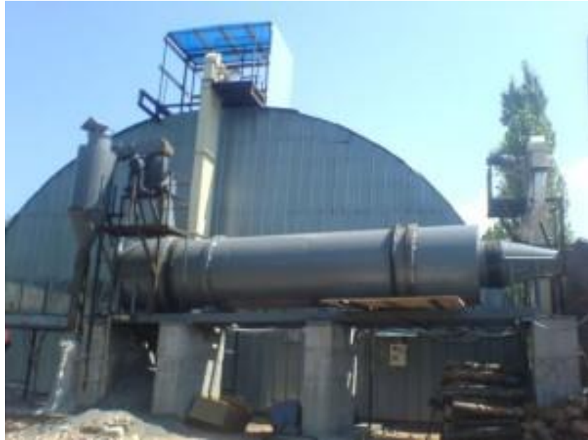
Рис. 6. Барабанна зерносушарка

За стаціонарного зберігання сухого зерна, яке пройшло післязбиральну доробку, серйозних труднощів зазвичай не виникає. Достатньо підтримувати вибраний режим і систематично контролювати стан зерна: температуру насипу, вологість, показники свіжості, зараженість шкідниками.