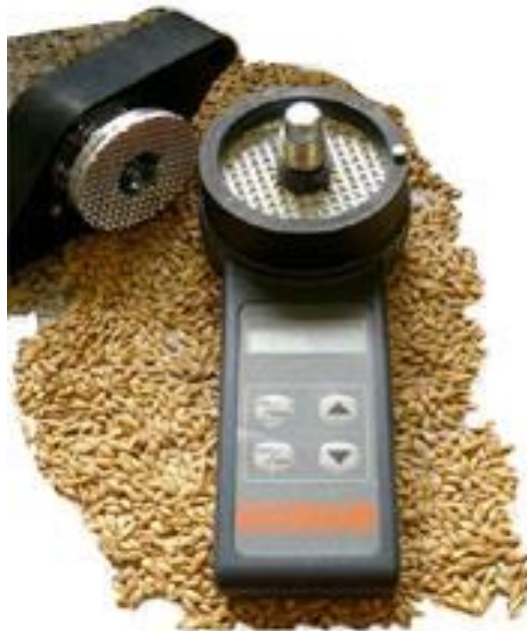
Рис. 23. Вологомір FARMPRO

Хоча переміщення вологи може відбутися в будь-який час, коли температура відрізняється в різних частинах сховища, найкритичнішим є період, коли тепле зерно зберігається за низьких зимових температур. Зазвичай зерно закладають на зберігання за його температури в 10 – 25 °С.