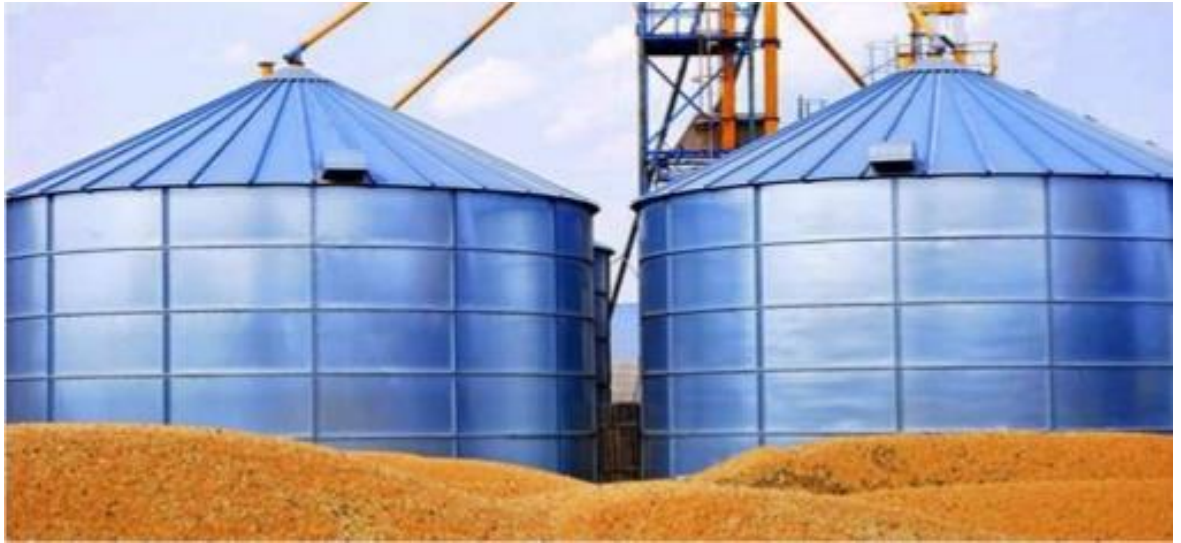
Рис. 15. Насіннесховище силосного типу

Насіннесховище місткістю 3 тис. т (типовий проект 702 – 38) – силосне з чотирма рядами збірних залізобетонних елементів промислового виготовлення. Висота силосів 12 м. Можна також побудувати його в комплексі з насіннеобробним цехом.