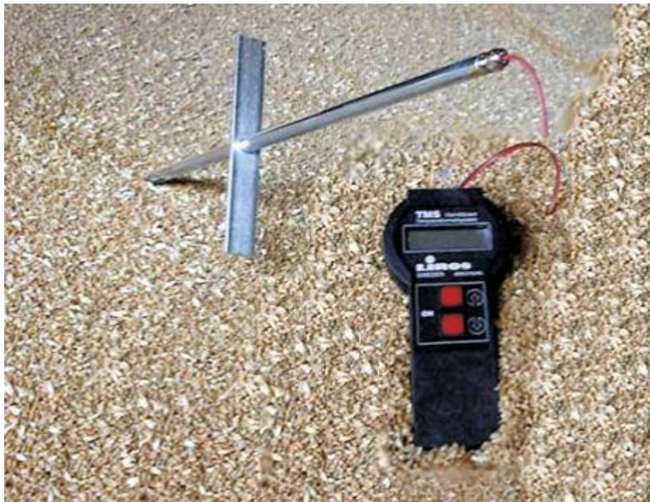
Рис. 20. Ручний індикатор температури GW-200

Для індикації температури вручну всередині зернового насипу використовуються ручний індикатор температури GW-200 (рис. 20)