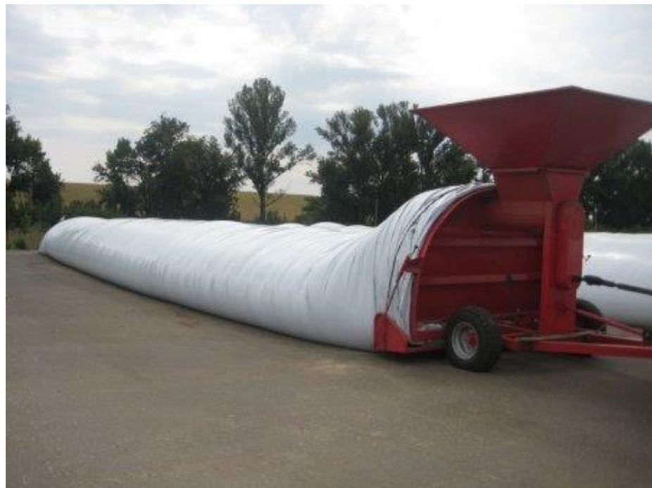
Рис. 9. Закладання зерна на зберігання в поліетиленові мішки-рукава