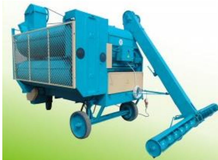
Рис. 3. Насіннеочисна машина СМ-4

різні режими сепарування. Режим очищення-сортування добирають до кожної культури окремо. Але в кожному конкретному випадку режим уточнюють, виходячи із фактичної чистоти і крупності зернівки, її вологості. Особливу увагу слід звернути на добір підсівних решіт, які є основними, оскільки визначають вихід і якість насіння та продовольчого зерна.