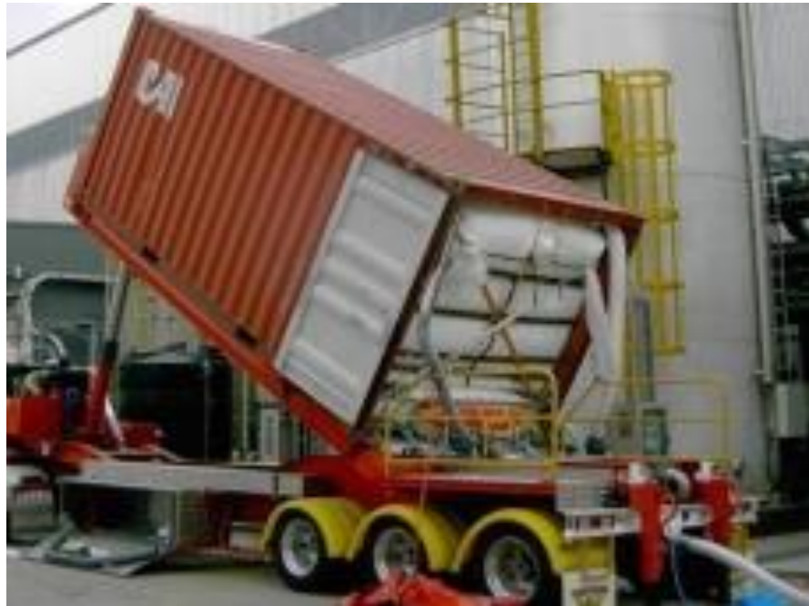
Рис. 11. Вивантаження герметичного контейнера

(тропіки, субтропіки) та при застосуванні спеціальних нейтральних газових середовищ, якими заповнюють простір між насінням у контейнері.