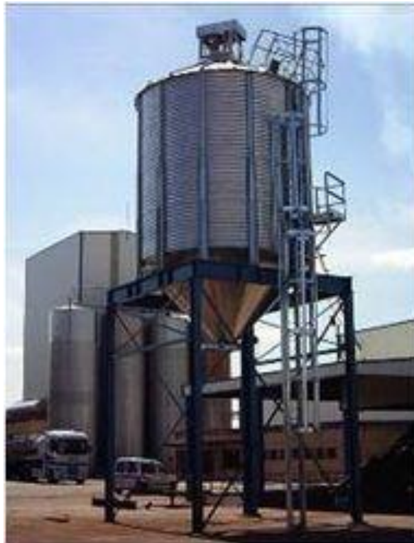
Рис. 16. Силос типу СВК на конусній основі

Бункери обладнані пристроями для дистанційного вимірювання температури, механізації, активного вентилявання з метою охолодження або сушіння зерна. Вони можуть бути використані для зберігання зерна як у сухому, так і в охолодженому стані.