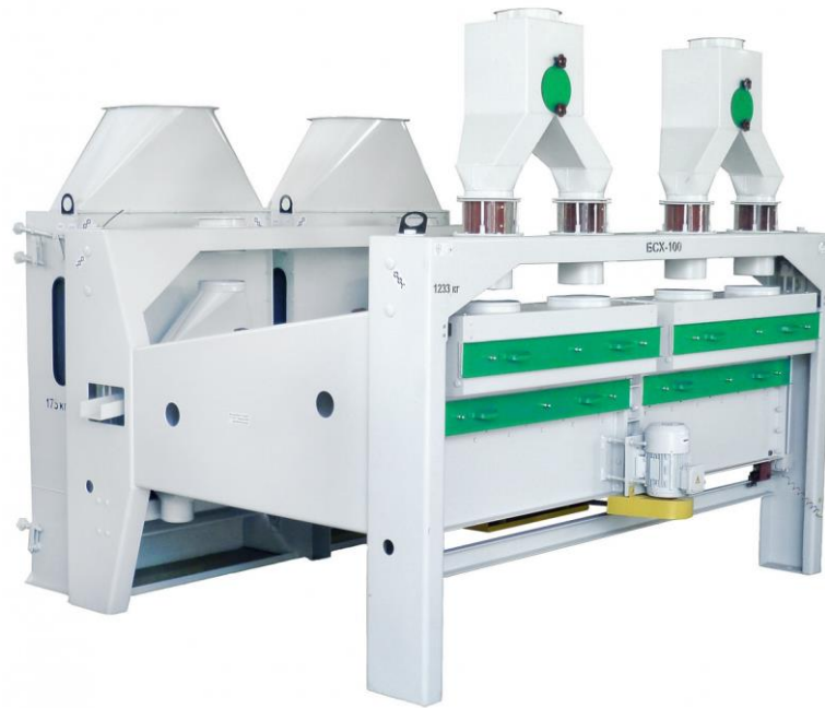
Рис. 4. Сепаратор BCX-100