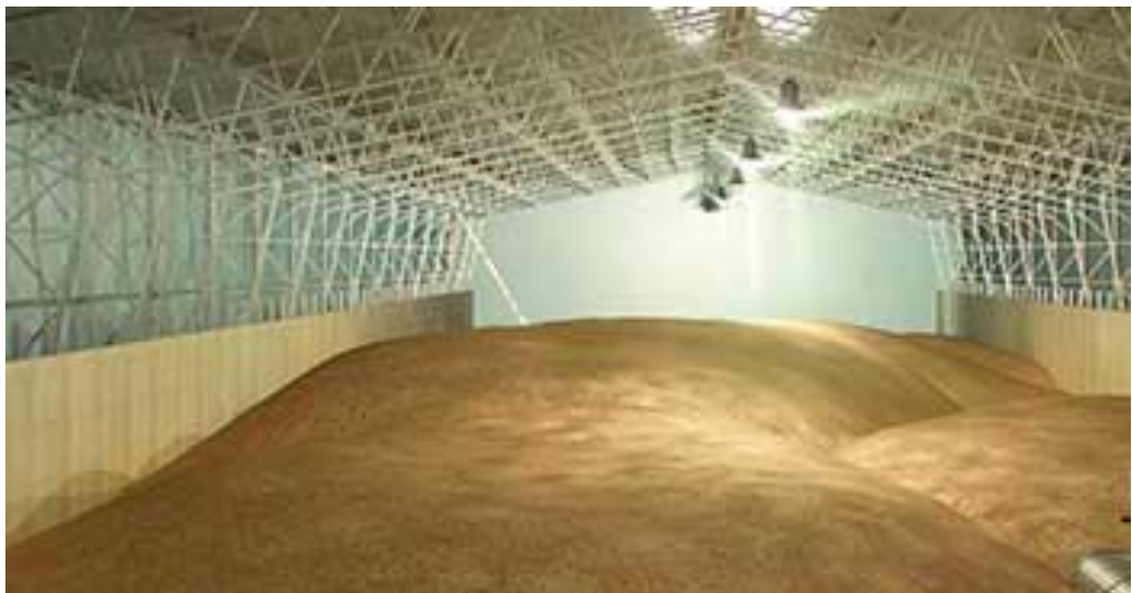
Рис. 10. Зберігання зерна насипом

Зернові маси зберігають насипом або в тарі. Основним і найбільш поширеним способом є зберігання насипом, оскільки добра сипкість зернових мас дає змогу механізувати їх завантаження, переміщення і вивантаження (рис. 9). Крім цього, за цього способу краще використовується площа та об'єм сховищ.