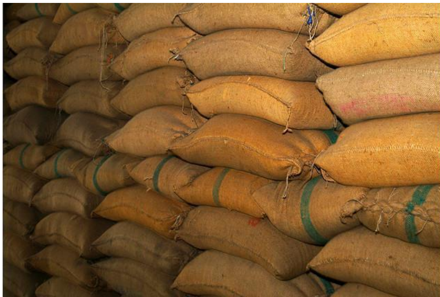
Рис. 12. Зберігання насіння у мішках

підлогою складають окремо у штабель на дерев'яні піддони які містяться на відстані від підлоги не менш як 10 – 20 см. Відстань між штабелями і стінами сховища – не менше 0,75, а між окремими штабелями – 1 метр. Висота штабелю для зернових і зернобобових культур та гречки – від семи мішків, для проса, сої, рицини, арахісу, гірчиці, ріпака – шість мішків. Відстань між штабелем і стіною сховища повинна бути не менше ніж 70 см.