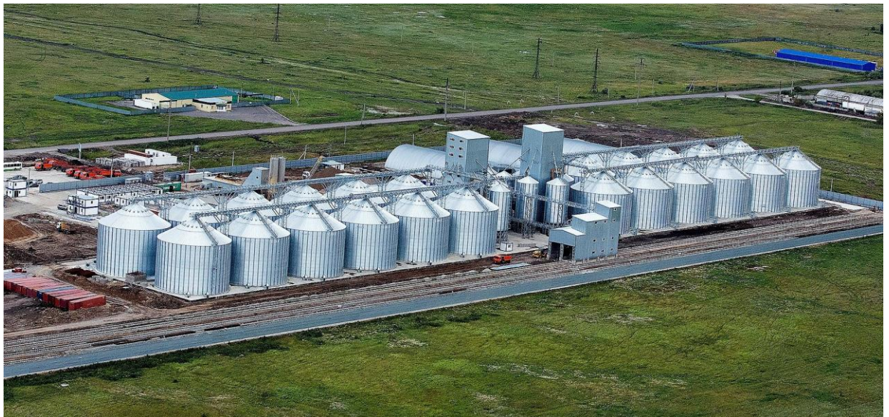
Рис. 19. Сучасний (фондовий) елеватор на 120 000 т зерна