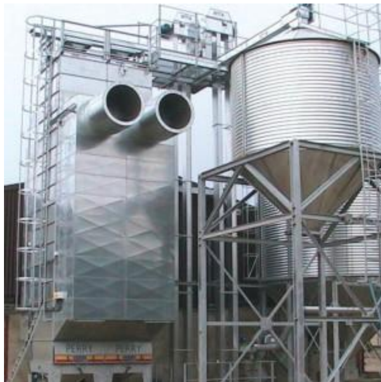
Рис. 7. Шахтна зерносушарка