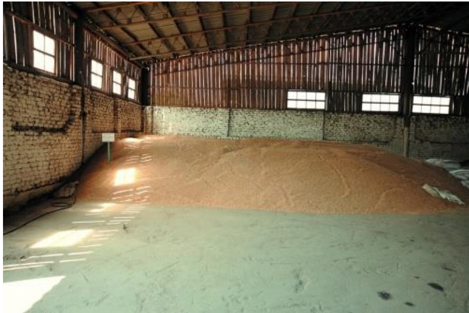
Рис. 1. Зерносклад приймає новий врожай

машинах) та подальшого режиму зберігання. Режим технологічних процесів установлюють і залежно від цільового призначення зернової маси.