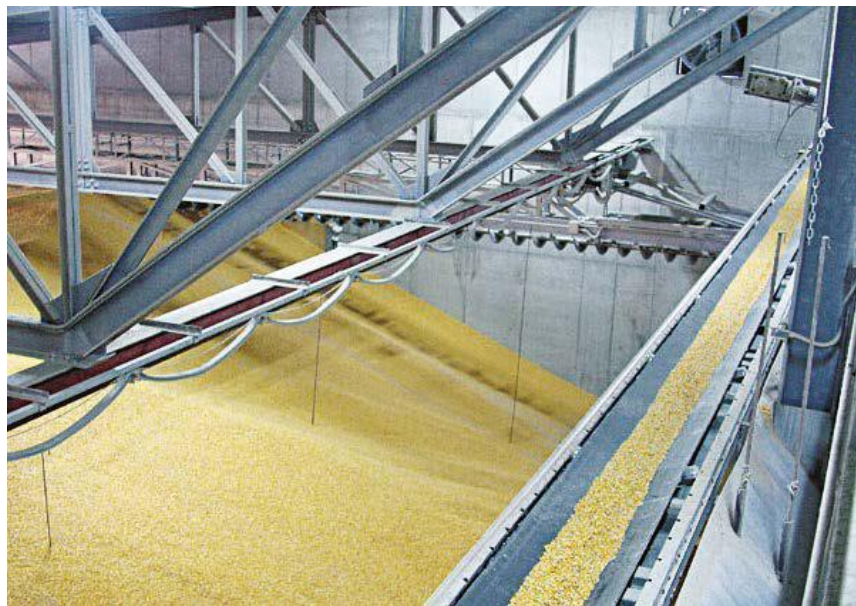
Рис. 13. Підлогове зберігання зерна в одноповерховому складі

Залежно від місткості зерносховища мають різні планувальні і конструктивні рішення. Невеликі за об'ємом зерносховища будують із місцевих будівельних матеріалів у вигляді одноповерхових однопрогінних