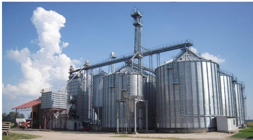
Рис. 17. Силос типу СВП на підлоговій основі