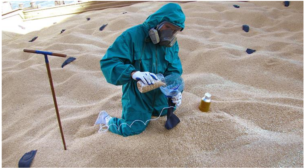
Рис. 25. Відбір зразків для визначення зараженості зерна шкідниками

За зберігання зерна в зерносховищах насипом або у контейнерах великої місткості проби відбирають з кожної партії масою до 25 тонн у п'яти місцях, масою більше 25 тонн – в 11 місцях.