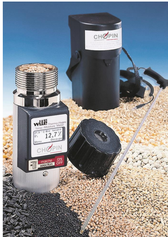
Рис. 24. Вологомір WILE-65

70 %, то ця вологість із повітря обов'язково буде перерозподілена і потрапить у зерно.