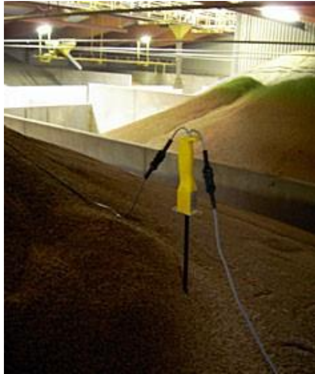
Рис. 21. Вимірювальний спос всередині зернового насипу

В сучасних силосних зерносховищах широко впроваджуються автоматизовані системи термометрії, до яких зокрема, належить система дистанційного контролю температури (СДКТ) ІННОВІНПРОМ (української компанії з розробки систем автоматизації виробництва).