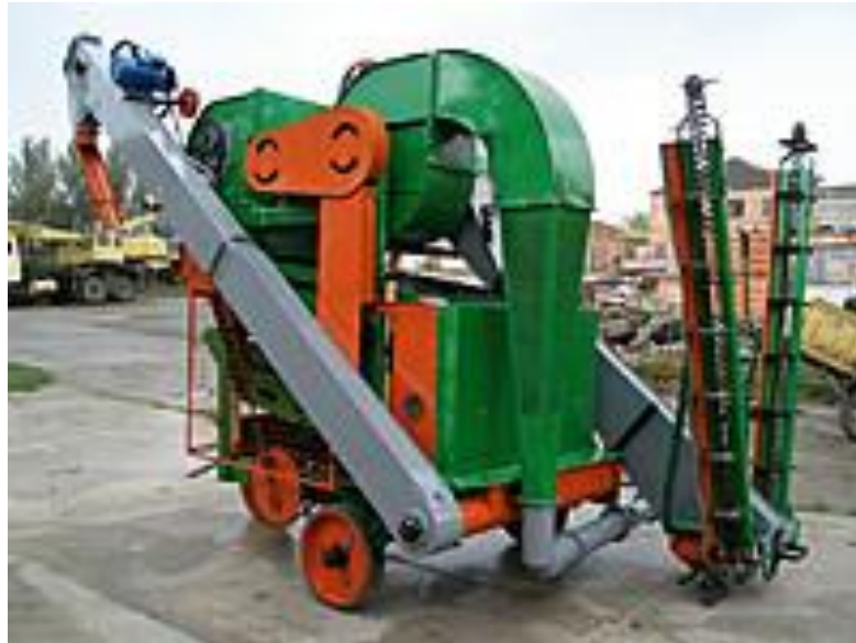
Рис. 2. Ворохоочисна машина ОВС-25

його треба негайно, щойно зерно надійде на тік. У разі затримки з очищенням зерно зволожується на 3 – 4% і більше. Очищення багато в чому убезпечує зерно й від самозігрівання. Адже домішки мають вищу вологість і заселені мікрофлорою. Ця операція здійснюється за один пропуск зерна через ворохоочисну машину (рис.2).