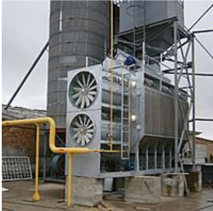
Рис. 8. Колонкова зерносушарка

Зерно різних культур відрізняється умовами сушіння. Так, зерно пшениці та жита має товсту оболонку, що сповільнює випаровування з нього вологи, але завдяки високій термостійкості його можна нагрівати до 60 °С, і процес сушіння проходить інтенсивно за температури сушильного агента до 90 °С. Головною особливістю сушіння зерна кукурудзи є його низька вологовіддача порівняно із зерном інших зернових культур. Тому під час сушіння зерна кукурудзи необхідно забезпечити максимальну подачу тепла і повітря з температурою теплоносія 120 °С.