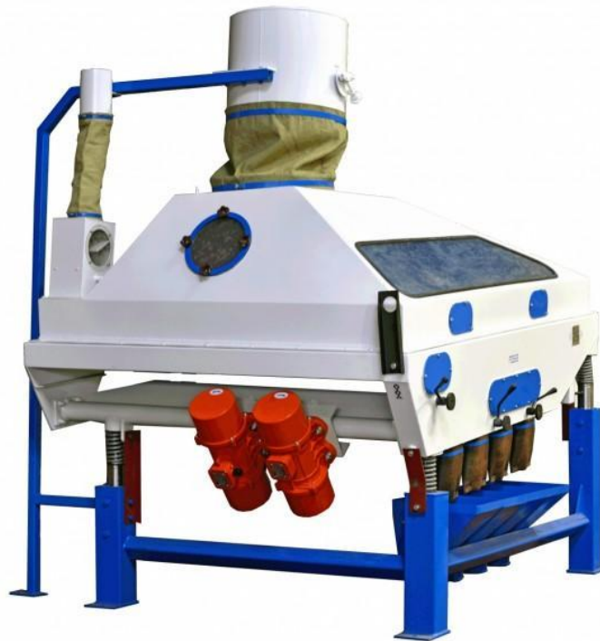
Рис. 5. Пневмосортувальний стіл ПСС

Найбільш ефективним способом тимчасового консервування вологого свіжозібраного насіння є активне вентилявання його атмосферним повітрям. Через нерухомий насип зерна пропускають потік зовнішнього холодного