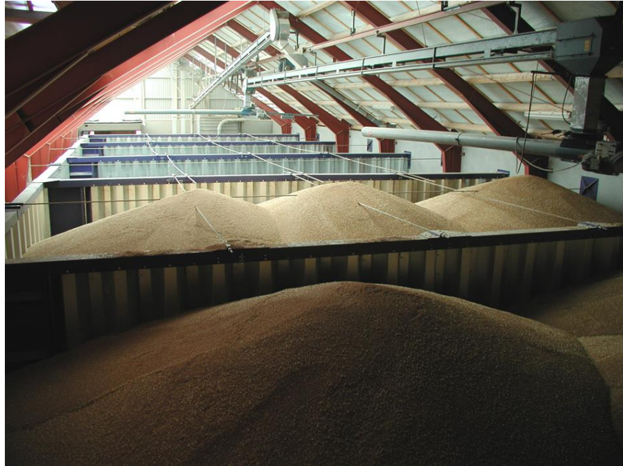
Рис. 14. Засікове зберігання зерна в одноповерховому складі

непротруєного насіння в мішках штабелями на піддонах (усього на 300 т). Крім складів, сховище має відділення для приймання, протруювання і затарювання насіння, які розміщені у двоповерховій будівлі, що прибудована до торця складу.